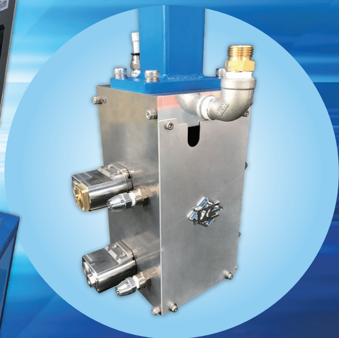
スプレーカセット

ダイカスト用離型剤塗布システム EcoShot™ パルススプレーシステム 詳細動画公開中